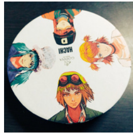
GODIVA×HACHI ドーナツホールコレクション ハチP (8粒入)